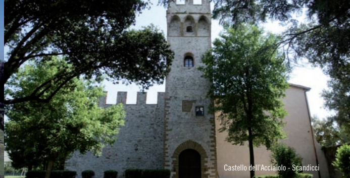
Castello dell'Acciaio - Scandicci