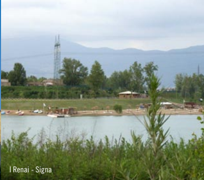
I Renai - Signa