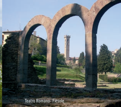
Teatro Romano - Fiesole