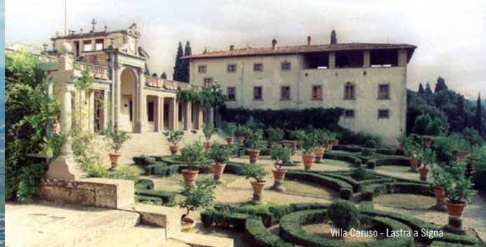
Villa Caruso - Lastra a Signa