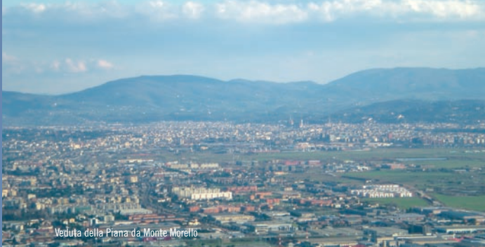
Veduta della Piana da Monte Morello