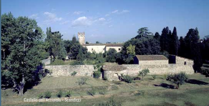
Castello dell'Acciaio - Scandicci