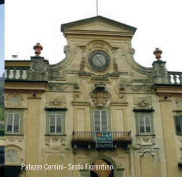
Palazzo Corsini - Sesto Fiorentino