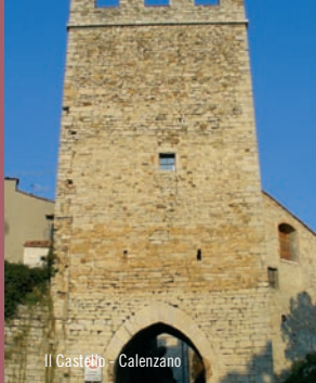
Il Castello - Calenzano