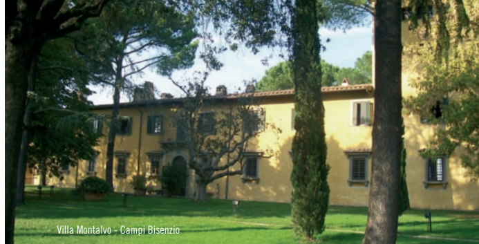
Villa Montalvo - Campi Bisenzio

Autocarrozzeria Unicar, via degli Alberti 3/c ☎ 055 8721720 - lolefra@gmail.com